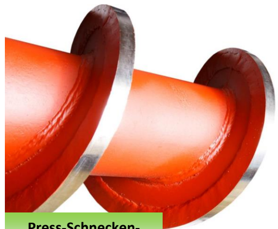
Press-Schnecken- Wellen aufgearbeitet