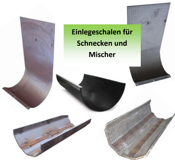
Einlegesohlen für Schnecken und Mischer

VERITEC AG hat Erfahrungen aus einer Vielzahl von eigenen installierten Anlagen sowie Anlagenkomponenten von Fremdfirmen, welche täglich dem Verschleiss unterworfen sind. Betreiber sind interessiert, eine erhöhte Standzeit ihrer im Einsatz stehenden Komponenten zu bekommen. Dadurch lassen sich Stillstände von Anlagen und Aufwand für Unterhalt optimal planen und kalkulieren.