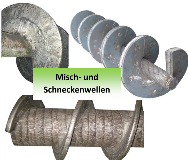
Misch- und Schneckenwellen

Wir haben mit keinem Lieferanten von Verschleisschutz-Materialien eine vertraglich bindende Zusammenarbeit. Somit garantiert VERITEC, dass wir ausschliesslich die Bedürfnisse der Endkunden vertreten und entsprechend beraten.