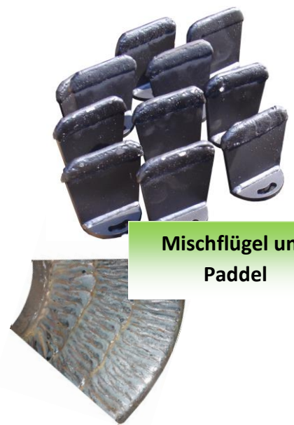
Mischflügel und Paddel

„Verschleisschutz .....Ja !.....so viel wie nötig, nicht so viel wie möglich“